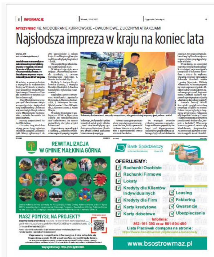
Rys. 4 Ogłoszenie o pracach nad programem rewitalizacji zamieszczone w Tygodniku Ostrołęckim.